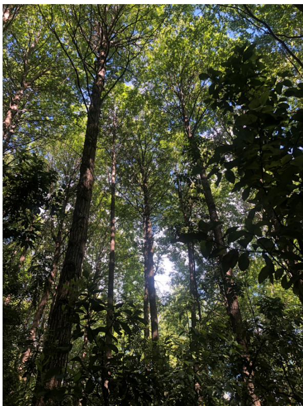
Figura 4. Plantación de N. alpina de aproximadamente 60 años con árboles de grandes dimensiones y abundante Persea lingue (Ruiz et Pav.) Nees en el sotobosque. A esta edad se puede efectuar una corta de protección irregular o bien iniciar la transición hacia un bosque de selección.

Nothofagus alpina plantation near 60 years of age with large trees and abundant Persea lingue in the understory. At this age an irregular shelterwood can be conducted or a selection system can be initiated.