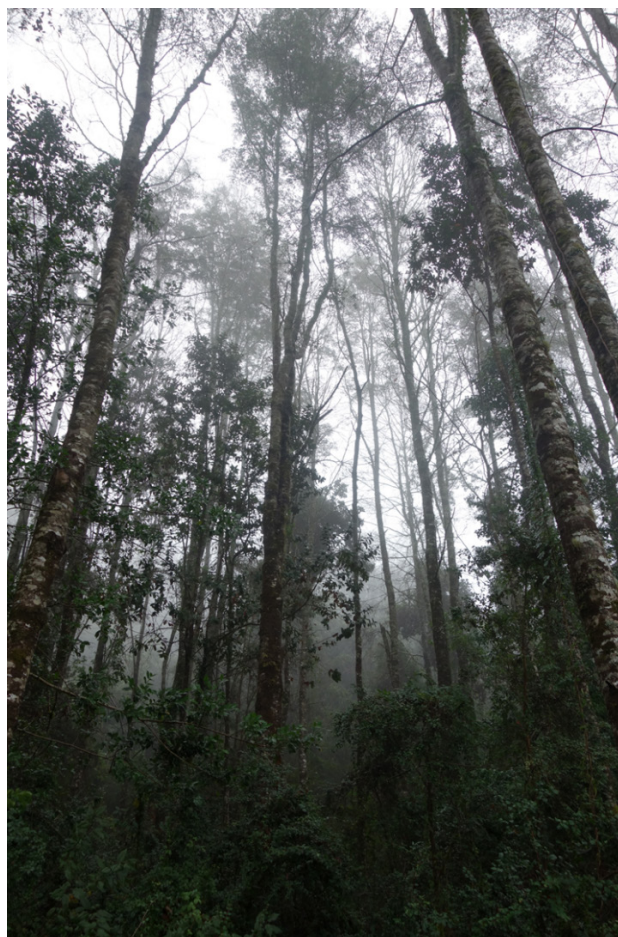
Figura 5. Plantación mixta de 30 años con especies de hoja caduca ( N. obliqua y N. alpina ) y perenne ( N. dombeyi , Eucryphia cordifolia Cav., Laurelia sempervirens Looser y Gevuina avellana Mol.)

Para efectos de abordar los compromisos internacionales de Chile en relación con cambio climático, es necesario un enfoque que persiga objetivos de mitigación y adaptación, incluyendo compromisos en materia de uso de la tierra, cambio de uso de la tierra y silvicultura (UTCUTS). Chile se ha comprometido a forestar 200.000 ha al año 2030, con al menos 100.000 ha correspondientes a cubierta forestal permanente, y 70.000 ha con especies nativas. En este escenario las plantaciones con especies nativas bajo modelos de silvicultura ecológica adquieren gran importancia. Este compromiso señala que los proyectos de forestación deben: a) promover la utilización de especies nativas, b) considerar el uso de especies pioneras de gran amplitud ambiental, y c) contribuir a la ordenación y restauración de los paisajes forestales (CONAF 2020). Las plantaciones con Nothofagus spp. satisfacen estos requisitos, y a partir de ellas se puede avanzar para generar bosques complejos y adaptativos. Chile debe continuar estableciendo y manejando plantaciones forestales, pero en un contexto de mayor diversificación, aceptación social y