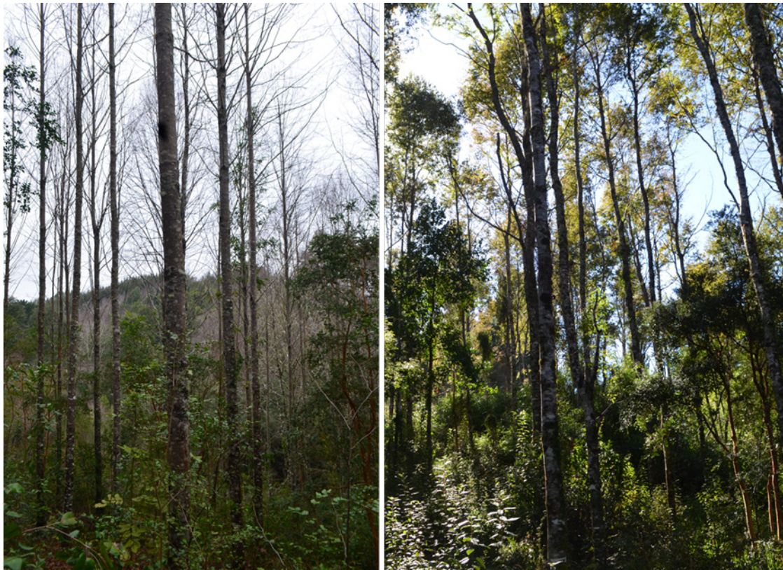
Figura 3. Plantaciones de N. alpina (izquierda) y N. dombeyi (derecha) de 25 años con poda y raleos, lo que ha permitido el ingreso de más luz al piso del bosque y la regeneración en el sotobosque.

Twenty five year-old N. alpina (left) and N. dombeyi (right) plantations with thinning and pruning that have allowed the entrance of light to the forest floor and regeneration that fills the understory.