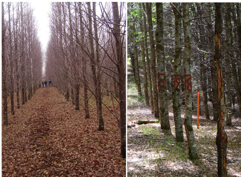
Figura 1. Plantaciones puras de N. alpina (izquierda) y N. dombeyi (derecha) de 12-13 años establecidas en praderas en la precordillera de los Andes en el centro-sur de Chile. No se ve regeneración y la diversidad estructural es pobre.

Pure 12–13-year-old plantations of N. alpina (left) and N. dombeyi (right) established on pastures in the Andean foothills in south-central Chile. There is no regeneration and structural diversity is poor.